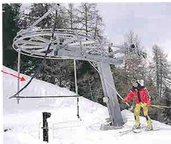
Bilde i leverandørdokumentasjonen av avstigning på tilsvarende heiser