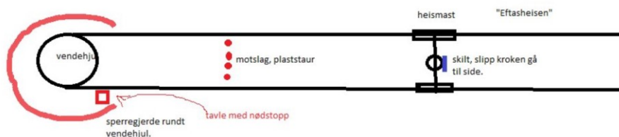
Nåværende arrangement av avstigning på Eftasheisen