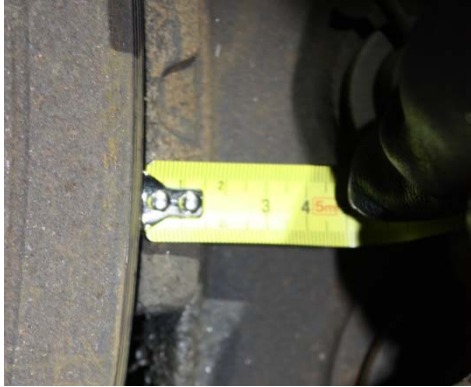
Tykkelse på bremsekloss